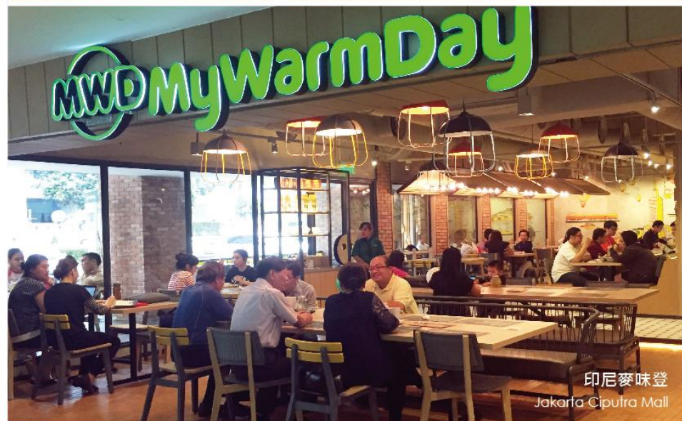
印尼麥味登 Jakarta Ciputra Mall