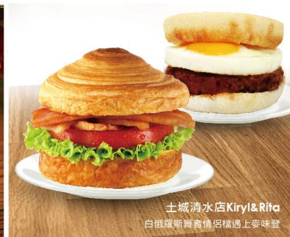
土城清水店KiryI&Rifa 白俄羅斯舞者情侶檔遇上麥味登