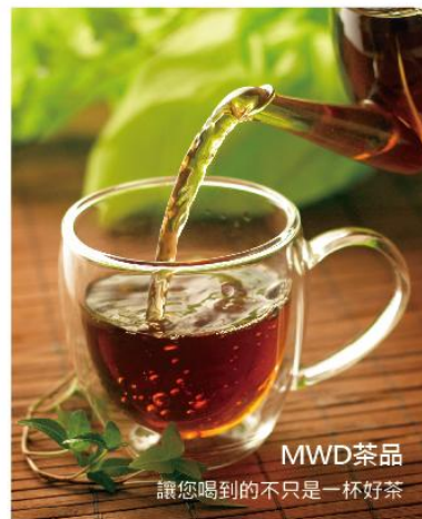
MWD茶品 讓您喝到的不只是一杯好茶